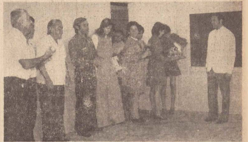
Prefeito amplia o setor educacional

onde voltou a reivindicar a construção do prédio onde seriam deslocados os cursos ginasiais. (Conclui na 2.ª página.)