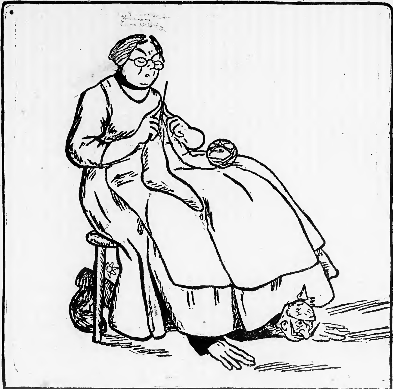
LA VOLPE PERDE IL PELO...

Sotto la Germania che lavora si nasconde l'antico militarismo. — (Dai giornali)