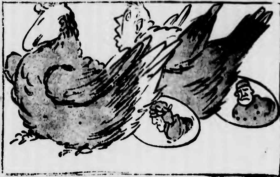
Le galline che fanno l'uovo col ritratto di Dante e d'altri italiani celebri