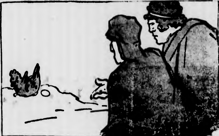
Dante: — Ho messo tanta gente nei cerchi dell'inferno, ma non avrei mai pensato che una gallina mettesse me in quel cerchio.

Ho riconosciuto e conosco tutte le varietà di tutte le razze di galline, ma la razza dantesca non l'avevo ancora conosciuta.