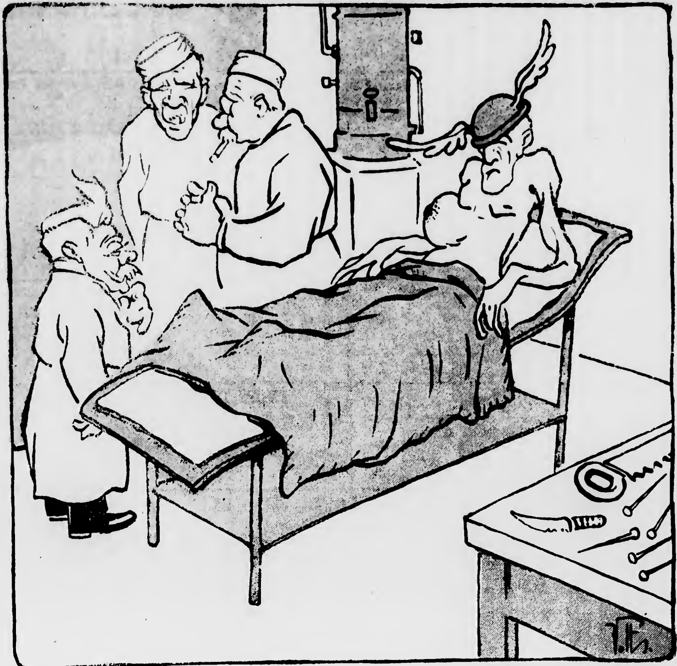
IL COMMERCIO: — Quando i dottori avranno trovato il rimedio io sarò già crepato...