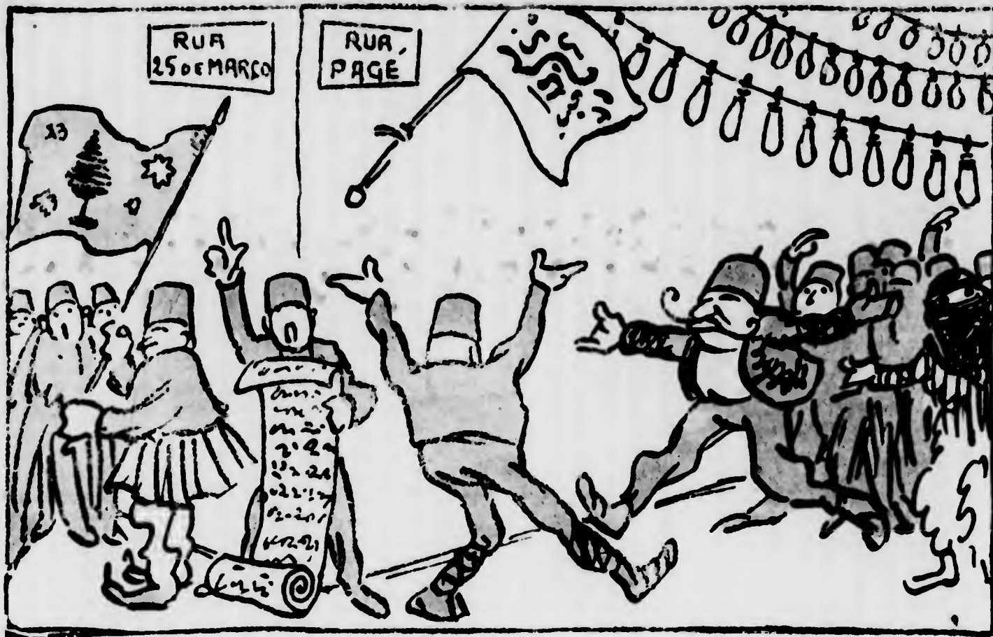
I grandi festeggiamenti della colonia siria per la gloriosa... facanha