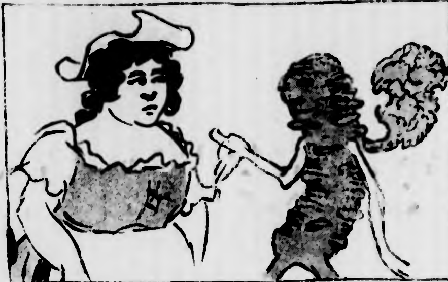
Il Targolo: — Hai sentito che il nuovo ministro degli Esteri vuole curare i deputati coloniali?

La colonia: — Non ci mancava che questo per assottigliare un po' la tranquillità.