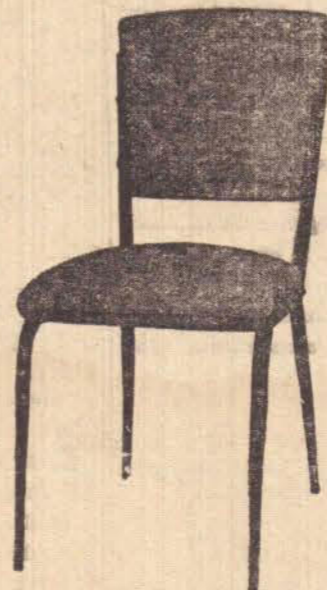
CADEIRA PRESIDENTE DESDE 490,00 POR MÊS

Copas Formica, Bufet, Mesas, Cadeiras, Ternos Estofados, Jogos de Area, Carrinhos de Chá, Barzinhos etc.