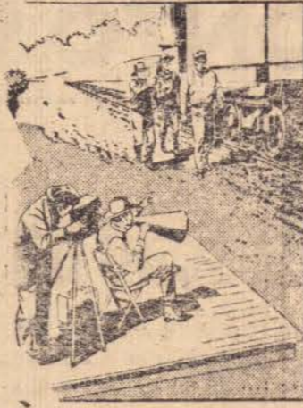
(2.º de 5)

PROGRESSO — O primeiro filme com enredo foi "O Grande Riho do Trem", feito em 1903 por Edison. O filme alcançou tanto sucesso que outras pessoas começaram a fazer películas com enredos.