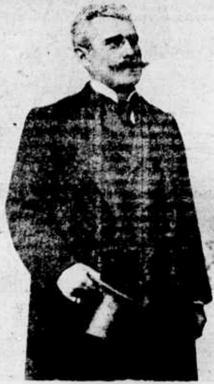
DR. JOÃO THOMAZ DE MELLO ALVES Ministro do nosso Tribunal de Justiça, fallecido tras-ante-hontem no Rio de Janeiro

Essa companhia, no contrato que tem com a municipalidade, assumiu algumas obrigações, de cujo cumprimento é fiscal a prefeitura. Está, além disso, sujeita a comminação de multas. Imaginemos que a Light deixasse de cumprir o contrato e