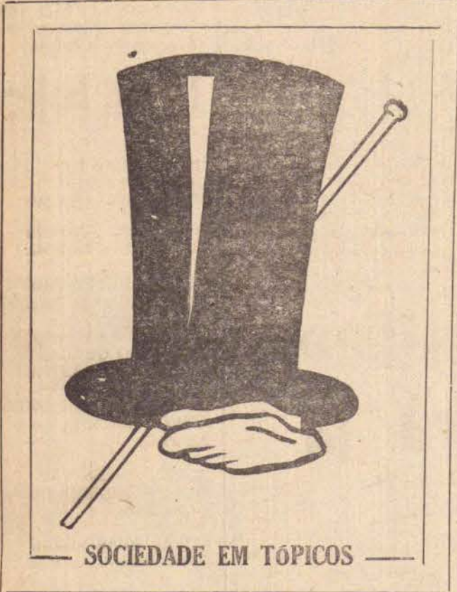
SOCIEDADE EM TÓPICOS