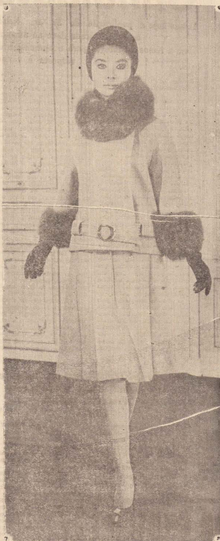
O inverno vem aí e aqui vai um modelo lançado para a próxima estação. Esta é uma criação de Pierre Cardin, tailleur em lã verde, com sala em pregas largas e casaco quarnecido de pelo de raposa bege.