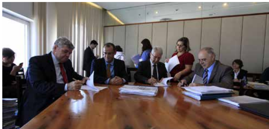
Assinatura dos acordos durante mutirão de conciliação

O mutirão realizado no último dia 22 de setembro