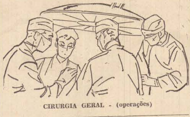
CIRURGIA GERAL - (operações)