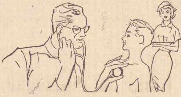
PEDIATRIA — (Moléstias de Crianças)

CIRURGIA GERAL E GINECOLÓGICA CLÍNICA DE SENHORAS RUA: SIQUEIRA CAMPOS, 810 TEL/ 3248 — A NOITE 3022