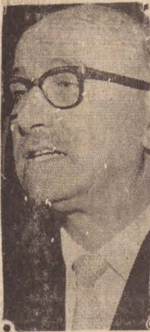
O Eng. Raphael Noschese presidente do FIESP-CIESP

A Federação das Indústrias do Estado de São Paulo e o Conselho Regional do Serviço Nacional de Aprendizagem Industrial, estão inaugurando em data de hoje a Escola "SENAI" de Presidente Prudente, local onde também inauguram busto de Roberto Simonsé.