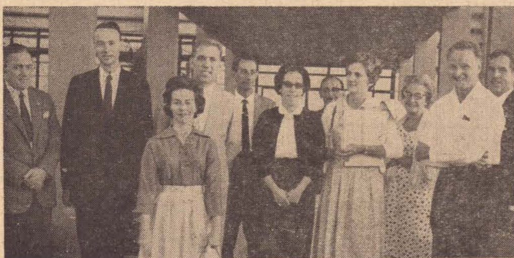
No clichê um flagrante da chegada do Adido Cultural, a nossa cidade, tomado no Aeroporto, onde vemos essa importante personalidade, em companhia de vários elementos da Colônia Americana, bem como da sociedade prudentina.