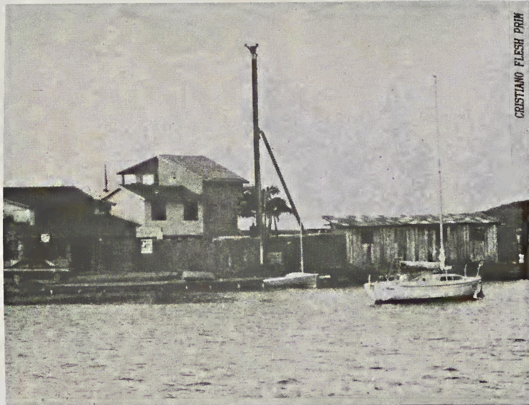
CRISTIANO FLESH PRIN