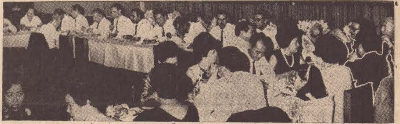
A objetiva de "O Imparcial" fixou o flagrante acima do encerramento da Concentração, que é preparatória da IV Convenção dos Contabilistas do Estado de São Paulo, no jantar no Tennis Clube.

Domingo, todos os participantes seguiram para Pres. Epitácio, onde após passeio à ponte interestadual, soborearam suculenta peixada.