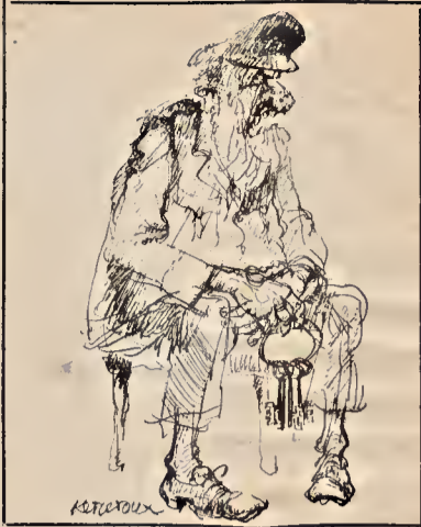
—Qué idea la de traernos aquí a estos «condenaos» políticos.

Durante los cuatro meses que llevamos en esta cárcel hemos solicitado repetidamente solución para estos problemas, así como para otros (higiene, por ejemplo), y la propia Dirección con su negativa sistemática nos ha mostrado que no tenemos otro camino que el de imponerlas mediante la lucha. Esta, comenzada ya con sucesivos planteamientos de desembocar, inevitablemente,