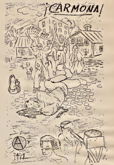
Grabado del manifiesto ácrata que denuncia el crimen franquista de Carmona

● Acusamos recibo igualmente de varias hojas, algunas de ellas, como el llamamiento de los presos de Zaragoza, remitidas simultáneamente por corresponsales de distintas localidades. Señalaremos en particular un manifiesto ácrata sobre los luctuosos sucesos del 1.º de agosto en Carmona (Sevilla), donde los bárbaros verdetapos abrieron fuego contra pacíficos manifestantes que protestaban por las deficiencias del suministro de agua y resultó un vecino muerto y varios heridos. El manifiesto aludido, después de exponer los hechos, hace la siguiente pregunta: «¿Hasta cuándo la humanidad tolerará esta paz de sangre y de terror?» En conclusión reproduce una cita de Malatesta que dice: «Guerra a la violencia. Este es el móvil esencial del anarquismo.