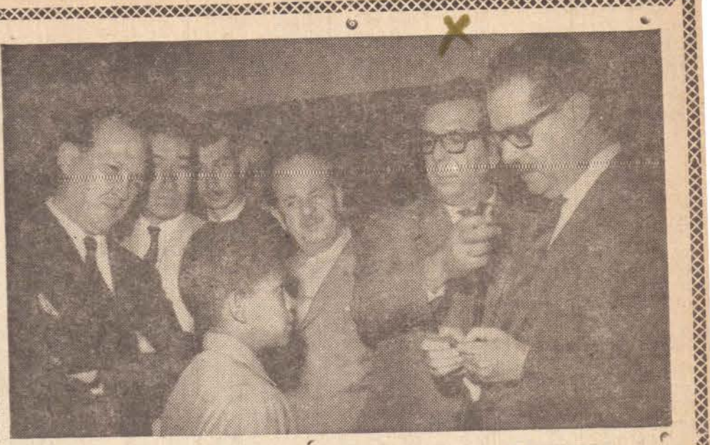
ROTARY UNIFORMISA ENGRAXATES

Recente notícia divulgada pela imprensa de São Paulo da conta de que o CONTEL proíba a cobrança, pelas Prefeituras Municipais, aos possuidores de aparelhos de TV, de taxas concernentes. A disciplinação do assunto vai originar no interior do Estado uma série de contratempos, pois não inúmeras as cidades que, a vista de lei da Câmara Municipal, adotam aquele expediente, para custear a manutenção das chamadas repetidoras de sinais.