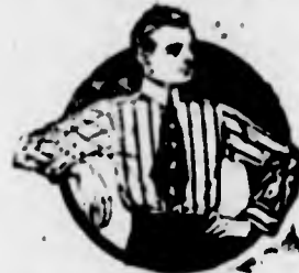
Camicie di legittimo zephir inglese a 11$200