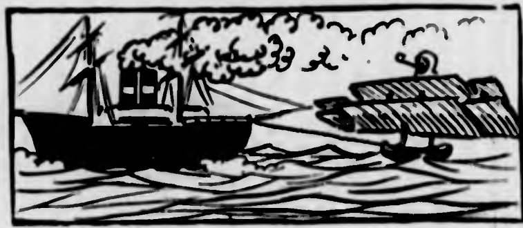
La prossima traversata dell'Atlantico in aeroplano