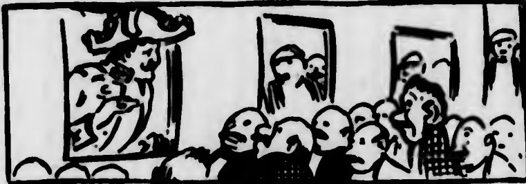
— State tranquilli ed abbiate fede! Appena sarò arrivato in Italia spedirò un vapore pieno di eroi!