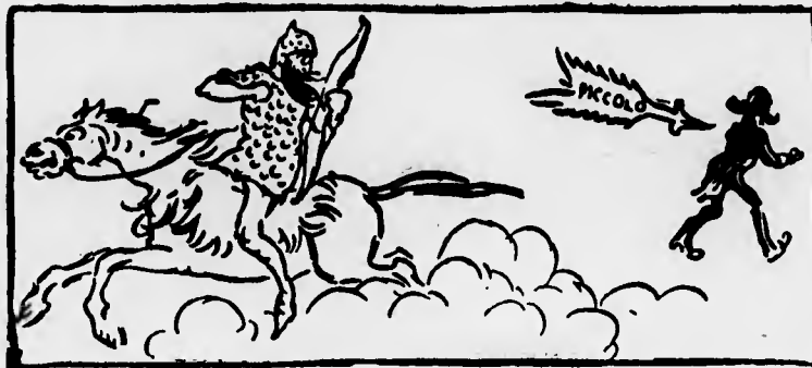
Barba-Parto:—Così imparerai un'altra volta a non darmi la minima importanza.