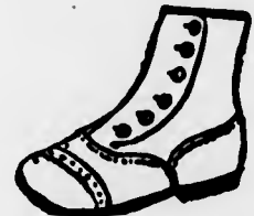
Stivaletti di "pellica", nera a 6$800.