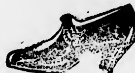
Scarpe per signora, diversi formati a 12$500

Le richieste dall'interno vanno aumentate col 10 o/o per le spese di spedizione. — NON CONFONDERE. — I nostri stabilimenti sono situati con