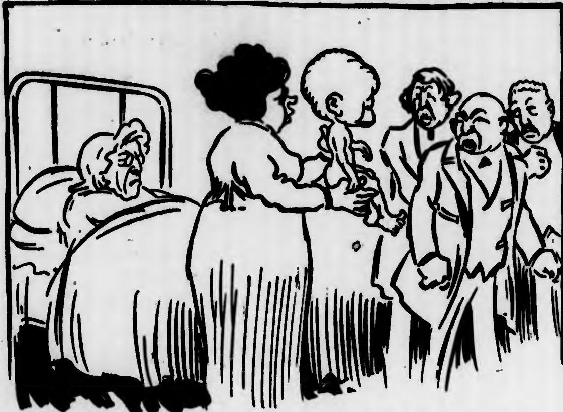
LA LEVATRICE: — Valeva la pena lavorarci in tanti per inettere insieme quest'aborto?