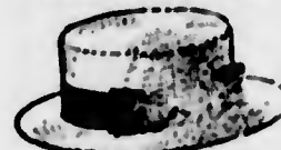
Capelli di paglia forata moderno, 7$500