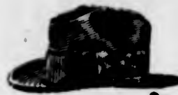
Capelli moderni colori variati, 7$500