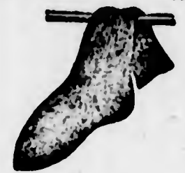
Calzette francesi, colori assortiti, 3 paio 4$500