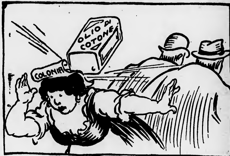
La colonia Povera me! Non ci mancava altro che questa bega, adesso!