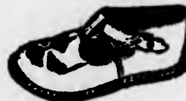
Sandali punteggiati di 18 a 26, 8$600