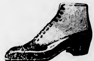
Calzature di "pellica", gambale di stoffa 19$600