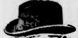
Capelli di legittimo pelo di lepre 14$500