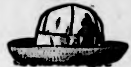
Capelli di "gorgorão", diversi colori, 5$800