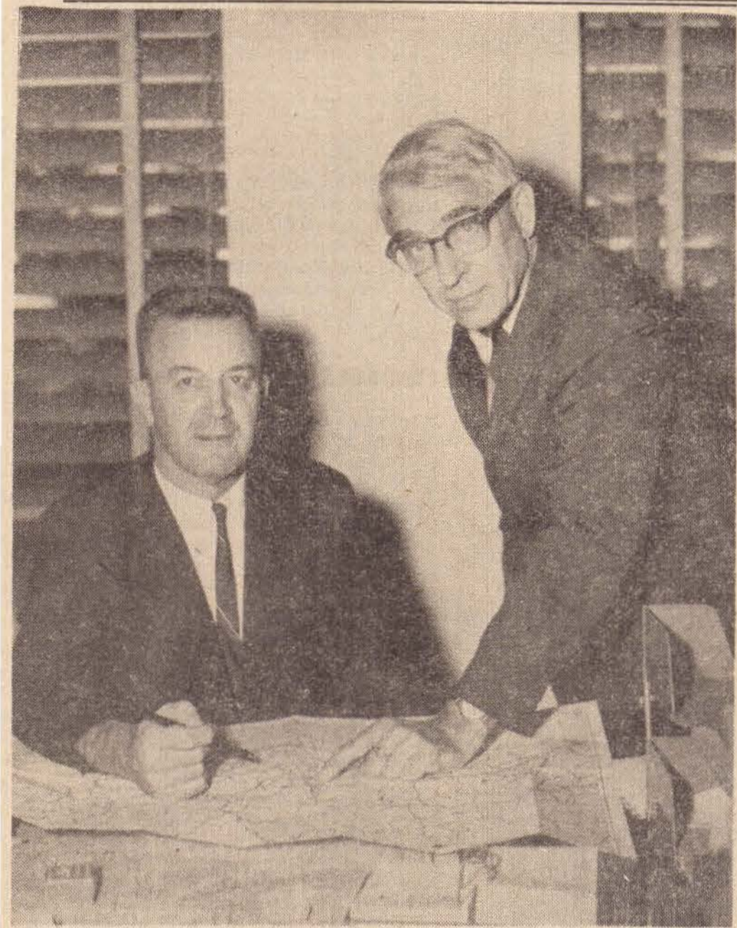
A esquerda sr. Richard Wooton Sub-Diretor do Serviço de Informações e Relações Culturais dos Estados Unidos da America, Embaixada Americana — Rio de Janeiro. A direita, Sr. Alan Fisher-Consul para São Paulo e Mato Grosso.

Juntamente com vários prefeitos da Alta Sorocabana, o prefeito Watal Ishibashi assistiu na quinta-feira última, reunião com o secretário da Agricultura, deputado Herbert Levy, realizada em São Paulo, quando foram tratados assuntos referentes à infestação nesta região da formiga "atta capiguara".