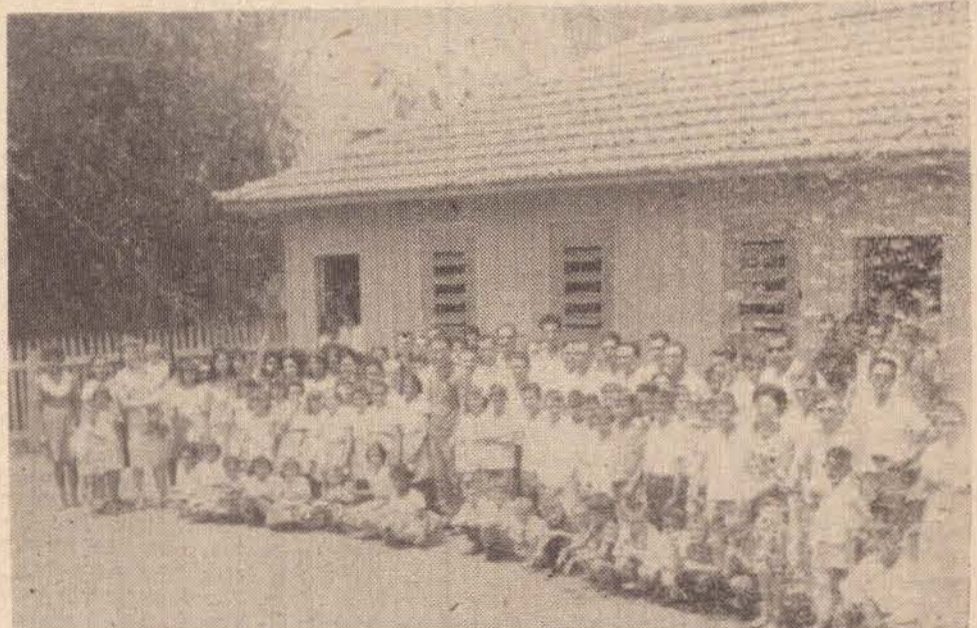
No clichet acima a fachada da Escola do Bairro da Ponte Alta tendo à frente alunos, professores e moradores do local, juntamente com as autoridades prudentinas que ali compareceram para a sua inauguração.