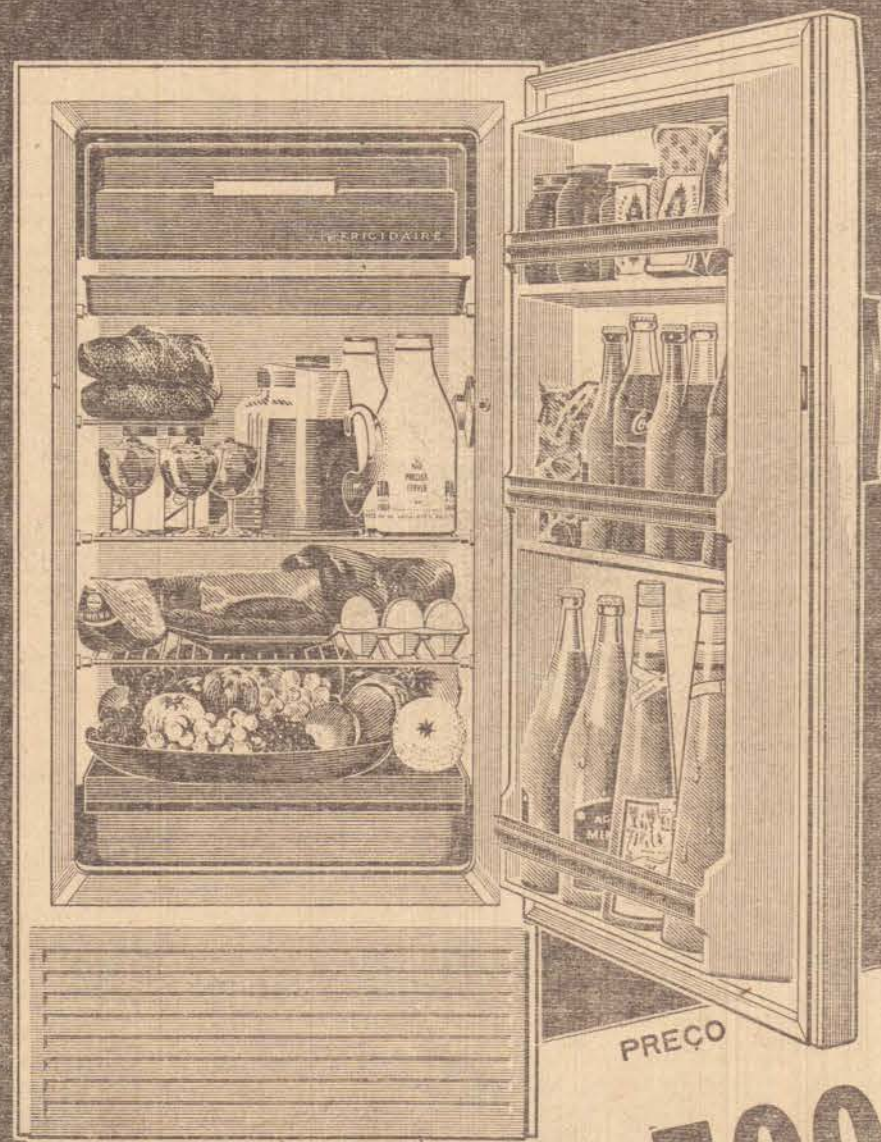
6,5 pés cúbicos

pequena e jeitosa...vale mais e custa menos!