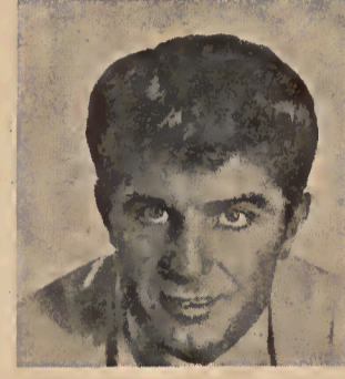
Niño de Murcia

COMPAGNIE LYRIQUE ET CHOREOGRAPHIQUE Folklore.