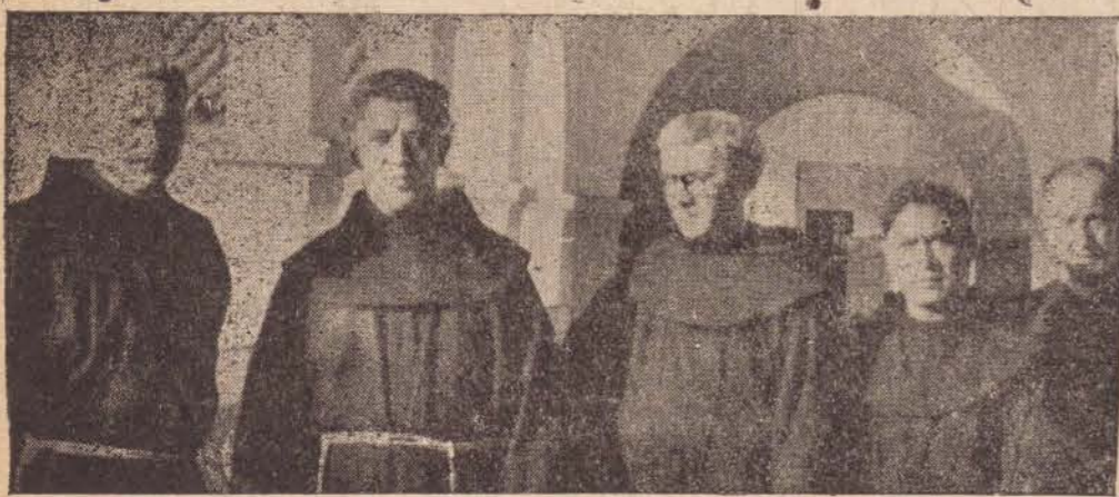
"Só com uma linha dessas, é que o CORINTINHA poderia fazer algum MILAGRE..."