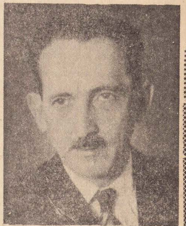
PARA DEPUTADO FEDERAL Plínio Salgado Número 149