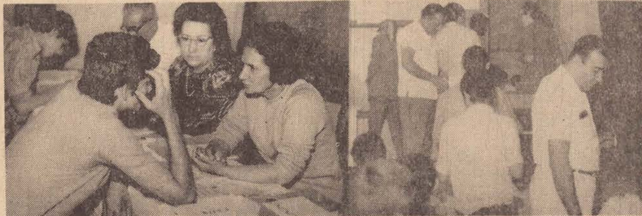
Alguns aspectos do local das provas