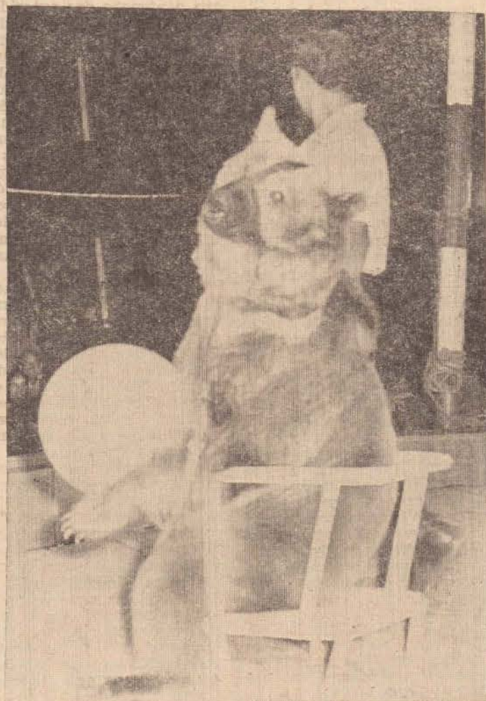
Ursos polares e da Rússia, fazem parte da grande fauna do Gran Circo Norte Americano. Frangente colhido no Ginásio Ibirapuéra, em São Paulo.

Amanhã — Sessões às 15,30 e 20,30 Horas (Armado na Av. Coronel Marcondes, esquina com Cassimiro Dias)