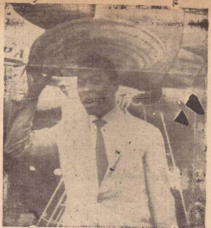
PELE, que logo mais terá arduo bloqueio a romper, a defensiva da Prudentina

Preparados Espiritualmente, a situação do quadro para este encontro, é das melhores pois, caso perca, estará fazendo-o para a mundialmente famosa esquadra do Santos e, na eventualidade de uma vitória, crescerá internacionalmente o prestígio futebolístico de P. Prudente. Diante de tal situação, resta-nos aguardar para ver o que poderá fazer, a Prudentina, na noite de hoje, frente ao quadro do «SIR» tratamento que lhe foi dado pelos ingleses EDSON ARANTES DO NASCIMENTO.