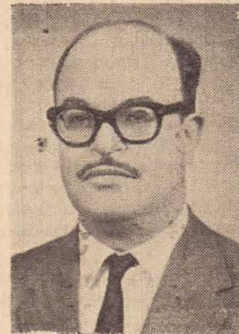
Hugo Lacorte Vitalle, presidente do PTB e candidato a Prefeito Municipal