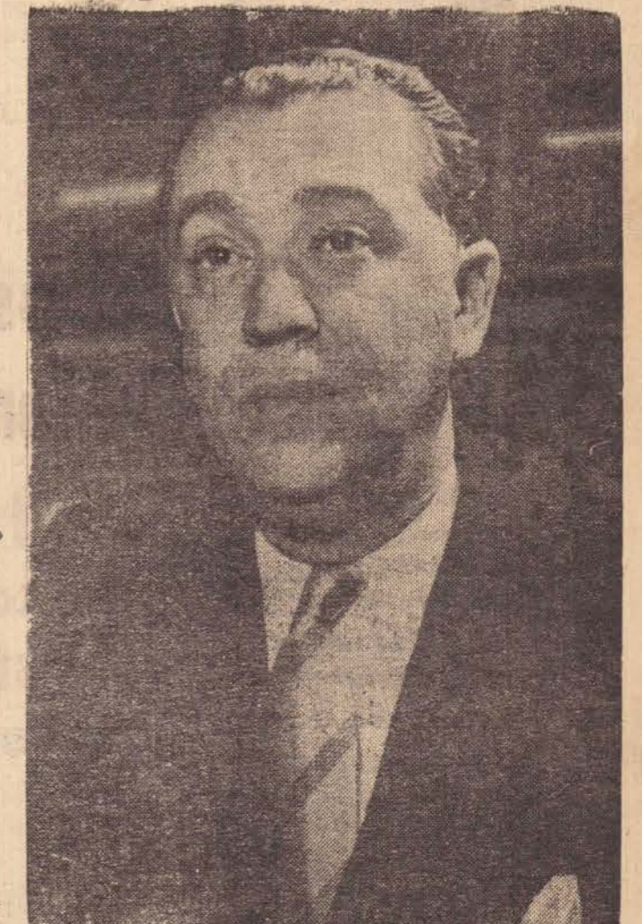
Juscelino Kubitschek, ex-presidente e membro diretor da Aliança para o Progresso visitará Prudente brevemente