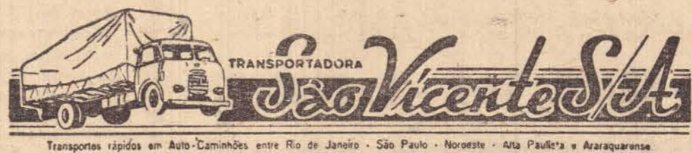
Transportes rápidos em Auto-Caminhões entre Rio de Janeiro - São Paulo - Nordeste - Alta Paulista e Araçatonga