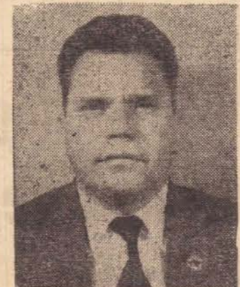
Antonio Sandoval Netto, vereador e ex-prefeito, novamente concorrerá ao cargo de prefeito