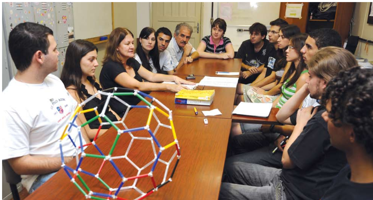
O pedido de progressão horizontal deve ser feito no momento da entrega do relatório docente