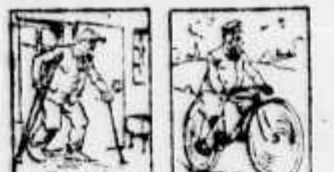
EFFETOS DO TRATAMENTO Por O. DMAIL