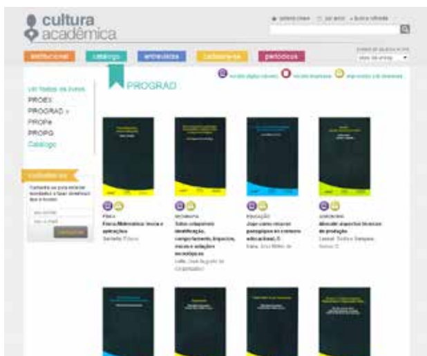
Livros podem ser baixados gratuitamente

A Pró-reitoria de Graduação (Prograd) da Unesp oferece, para download gratuito, em parceria com a Cultura Acadêmica, 43 livros. Eles podem ser baixados em < http://www.culturaacademica.com.br/colecoes.asp?col_id=12 >.