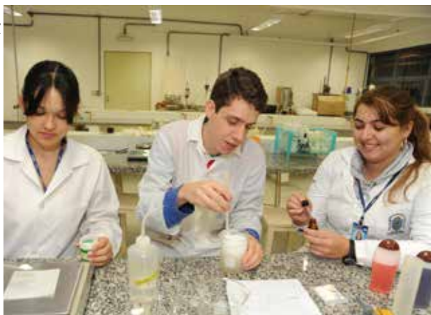
Foco é atender melhor os usuários do Sistema de Graduação

A Unesp lançou, em abril, o Sistema de Suporte ao Usuário do Sisgrad. Trata-se de um