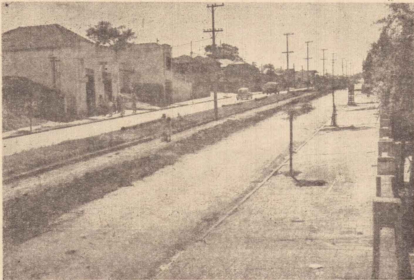
No flagante vemos uma vista da Avenida Cei. Marcondes, quando do início do enterramento dos tubos que formarão o anel distribuidor de água da cidade, que dentro em breve estará completo, facilitando assim, a distribuição do precioso líquido à grande metrópole prudentina.

"Zelai e amai as crianças de hoje, para que possam crescer confiantes no futuro." Campanha Rotary