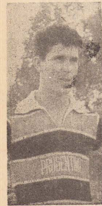
Capitão do elenco tricolor que estará a margem do compromisso de domingo