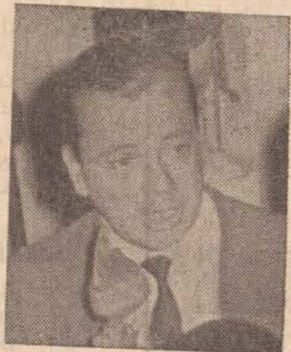
Governador Abreu Sodré

NATAÇÃO A Associação Prudentina de Esportes Atléticoes vai mandar sua representação de natação para Mococa, nos dias 12, 13, e 14 de janeiro. Ali se realizará o Campeonato Aberto Infante-Juvenil de Natação do Estado.