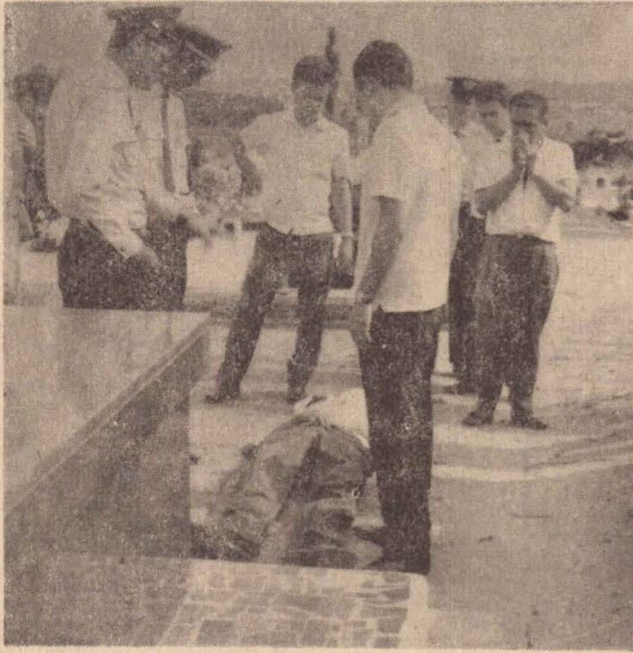
Corpo do desditoso jovem, no local da ocorrência, rodeado de autoridades policiais, logo após o suicídio.

A cidade foi sacudida na manhã de hoje, com a notícia do suicídio de um conhecido bancário de Presidente Prudente.