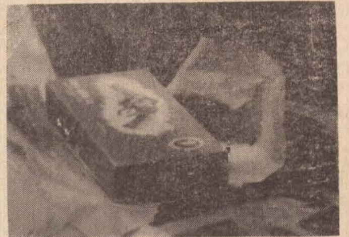
Caixa que continha o revólver Taurus, ao lado do túmulo de seu irmão. Notem os leitores, que ela está quase intacta.