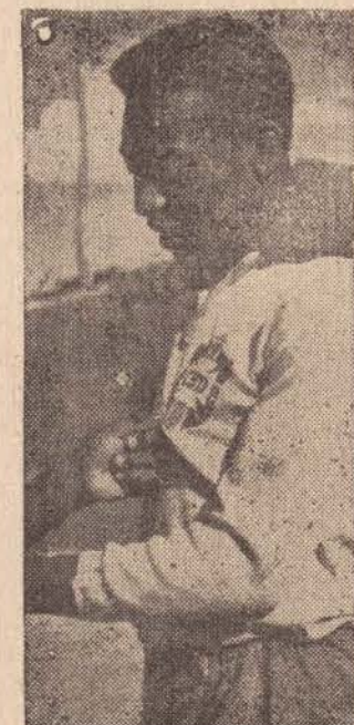
Pelé que retornou ontem da Alemanha e que reaparecerá frente ao Corinthians.

O atleta ao desembarcar declarou que vai reiniciar treinamentos e que deverá estar em perfeitas condições no próximo dia 6 de março quando o Santos enfrentará o Corinthians Paulista.