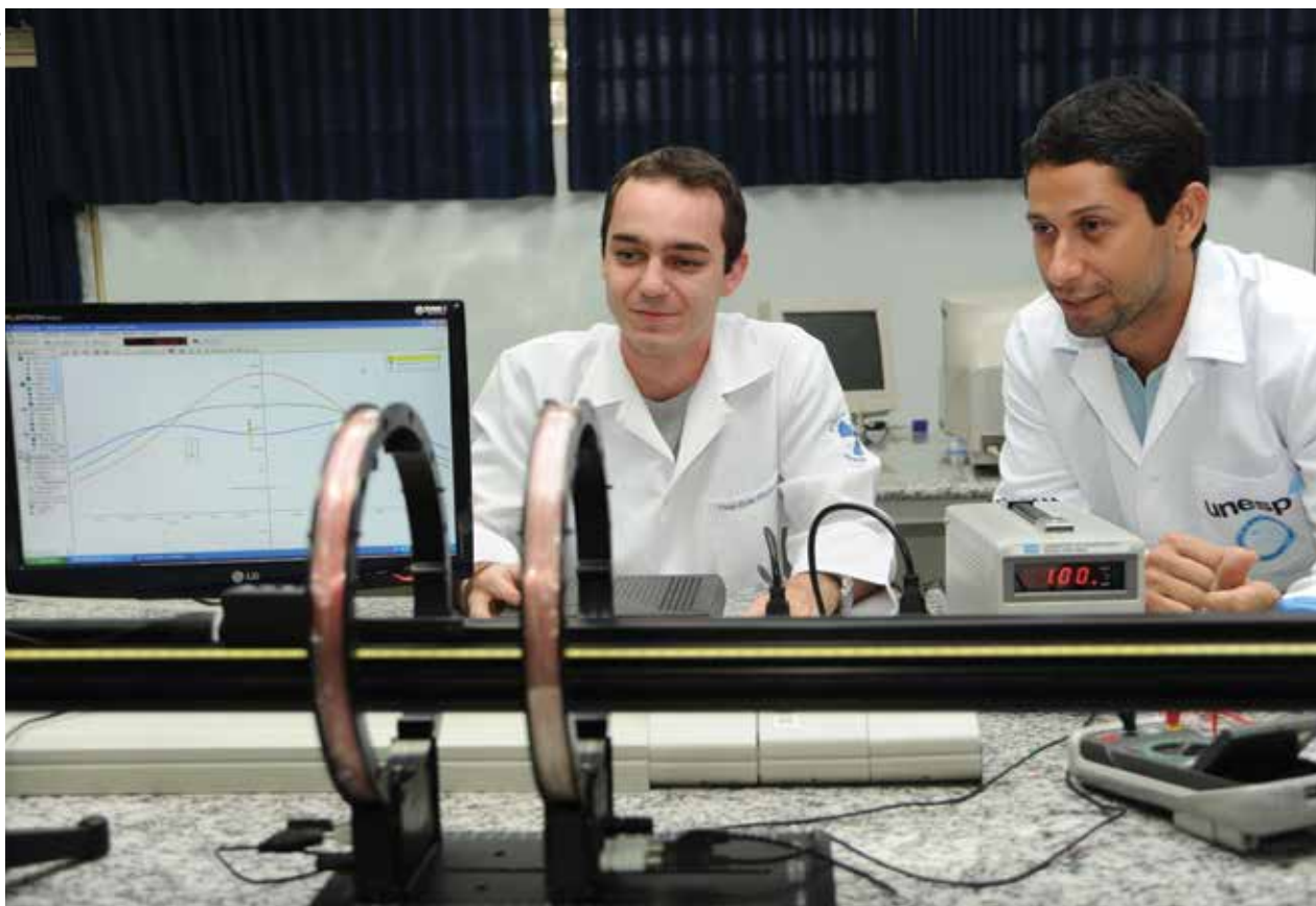
Avaliação é fundamentada em 13 indicadores de desempenho

O ranking dos países emergentes Times Higher Education (THE), divulgado em dezembro, em Moscou, Rússia, na abertura do Times Higher Education BRICS