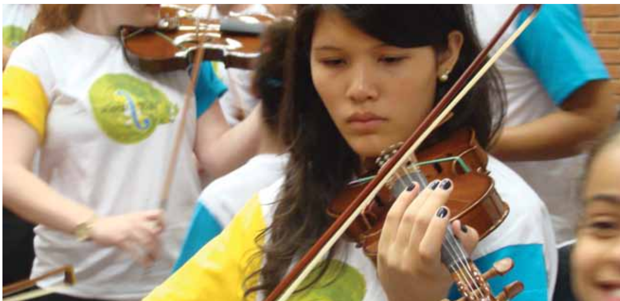
Programa de educação musical, intitulado A Corda Toda, é realizado no Instituto de Artes, no Câmpus de São Paulo