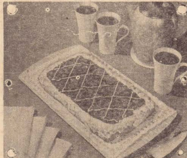
BOLO COM DAMASCO OU FIGO

Um bolo coberto de frutas secas é uma delícia! Nesta receita, você poderá utilizar damascos ou figos... usando a mesma massa básica!