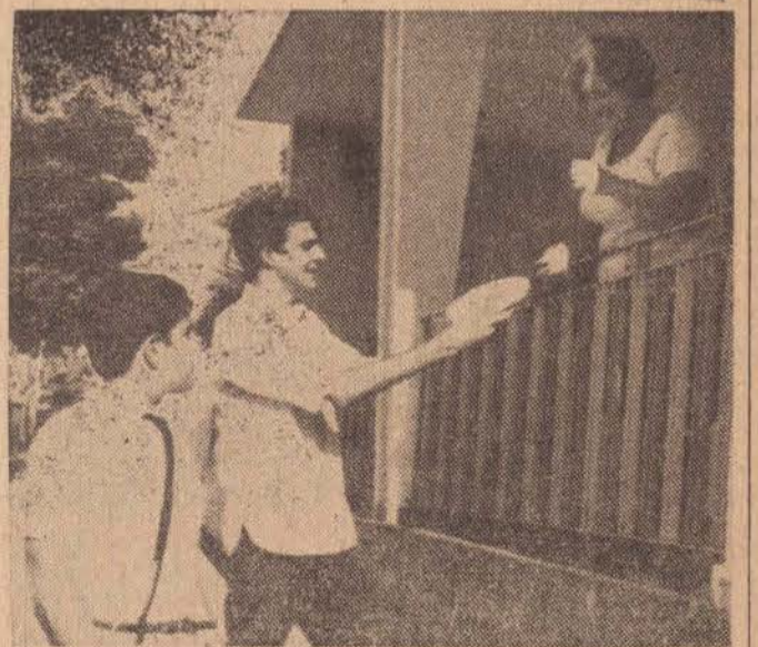
... "Um pratinho de arroz pelo amor de Deus!..."