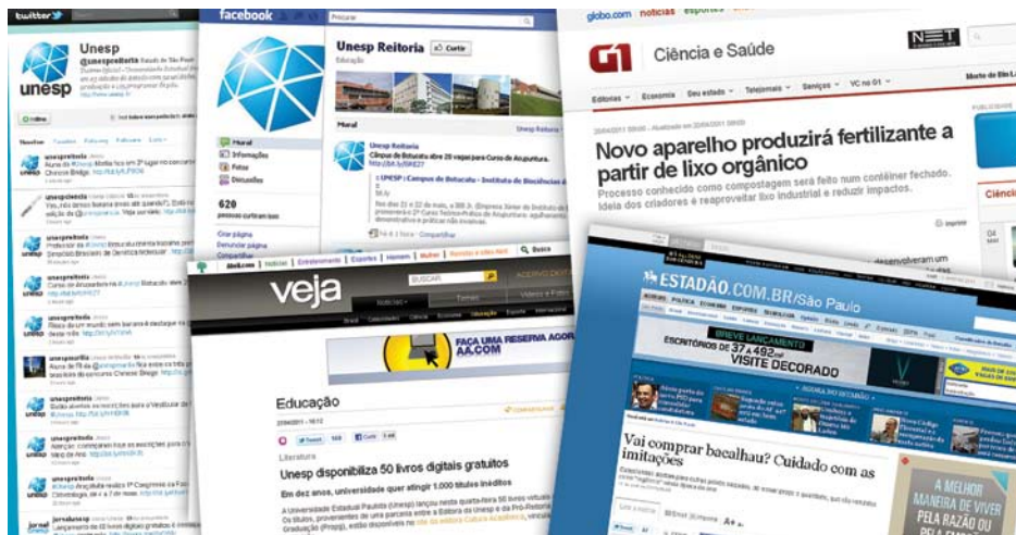
Unesp ganha espaço em jornais, revistas e portais e estreia nas mídias sociais