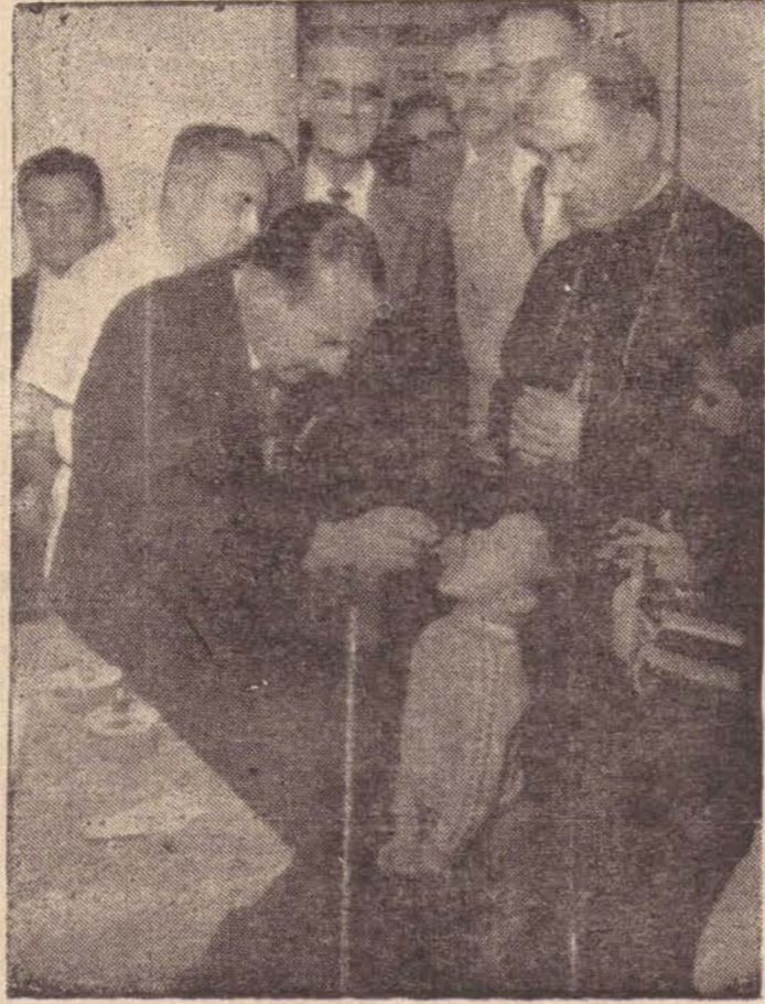
As campanhas anteriores erradicaram quase por completo a paralisia infantil na região.

lhor proteção da saúde de seu filho. Entre o magistério primário, a campanha deverá ter seu ponto máximo onde poderá então, dar mais frutos.