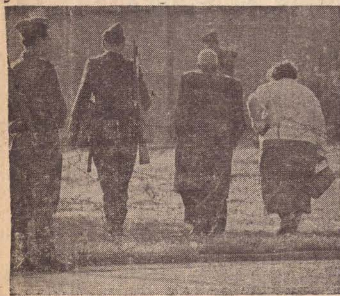
A Nina para o Kruchev:

— «Não é para criar um incidente. Mas bem que eu desconfiava que aquele soldado americano ia jogar pó-de-mico em mim».