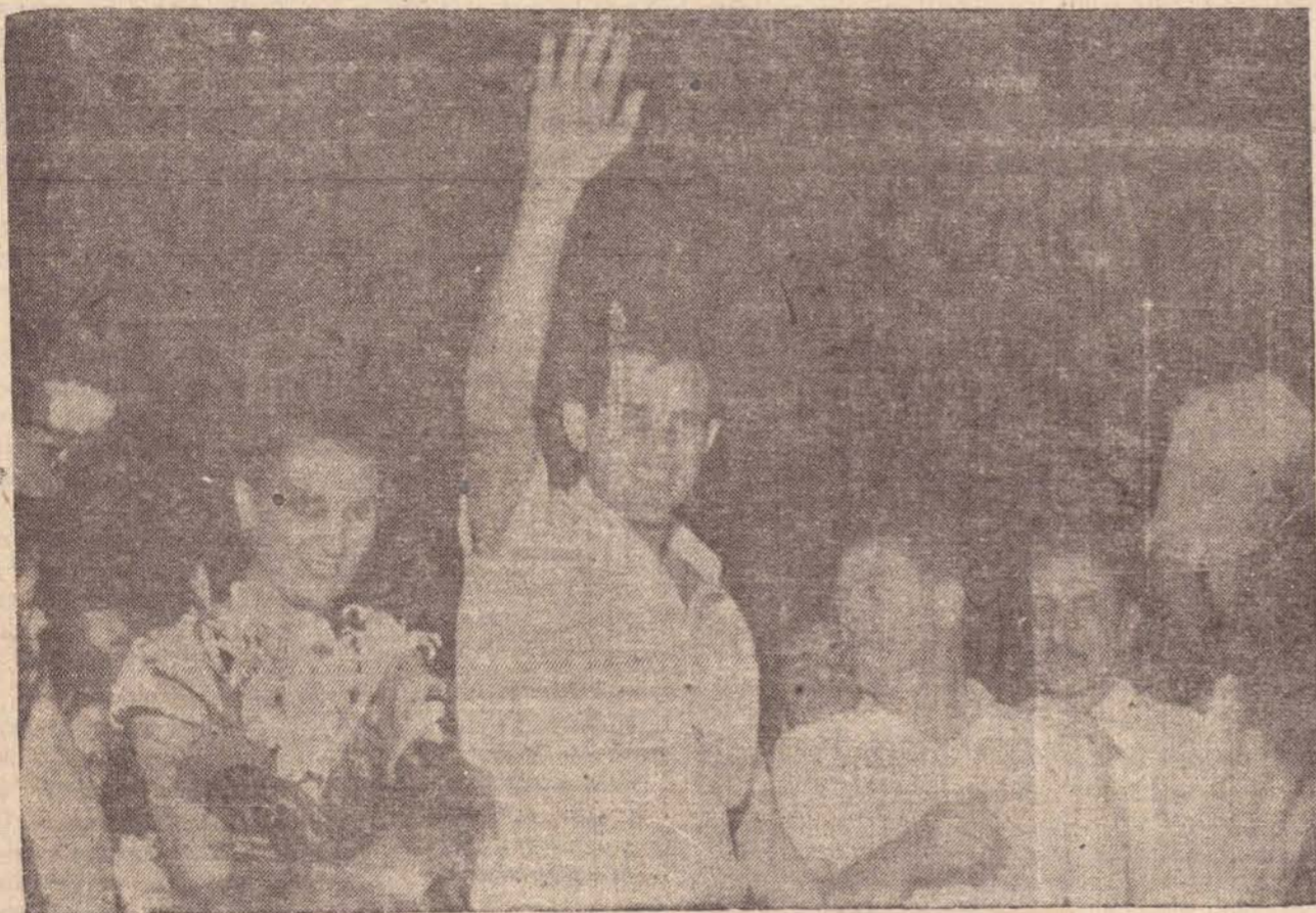
ABRAM ALAS! AQUI VAMOS NÓS, OS PROTAGONISTAS DE FOTOGOZADAS!

veja nas páginas internas, mais esta produção do novo IMPARCIAL