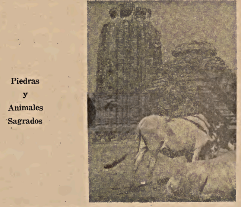
Piedras y Animales Sagrados

Personalmente considero que si una esperanza hay que abrigar en la victoria de los ideales anti-estatales, esta esperanza hay que depositarla en el socialismo libertario agrario que ya hemos comentado. El anarquismo, como movimiento organizado, tal como se ha desarrollado en Europa y América y en el propio Japón, no ha tenido incremento en la península indostánica, precisamente por es-