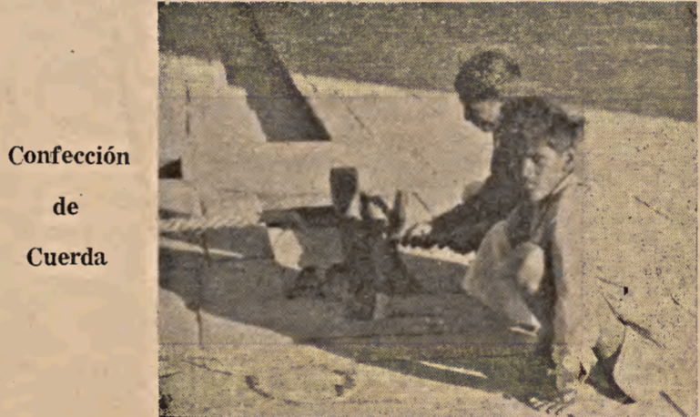
Confección de Cuerda

Porque tolstoiano es Gandhi. Es "Satyagraha" integral el párrafo de Tolstoi: "Si en todos los países del mundo, los obreros de las ciudades y de los campos cesasen de obedecer al Gobierno, el poder de éste desaparecería y, por sí misma se desvanecería la servidumbre que sólo se mantiene por nuestra sumisión voluntaria" (29).