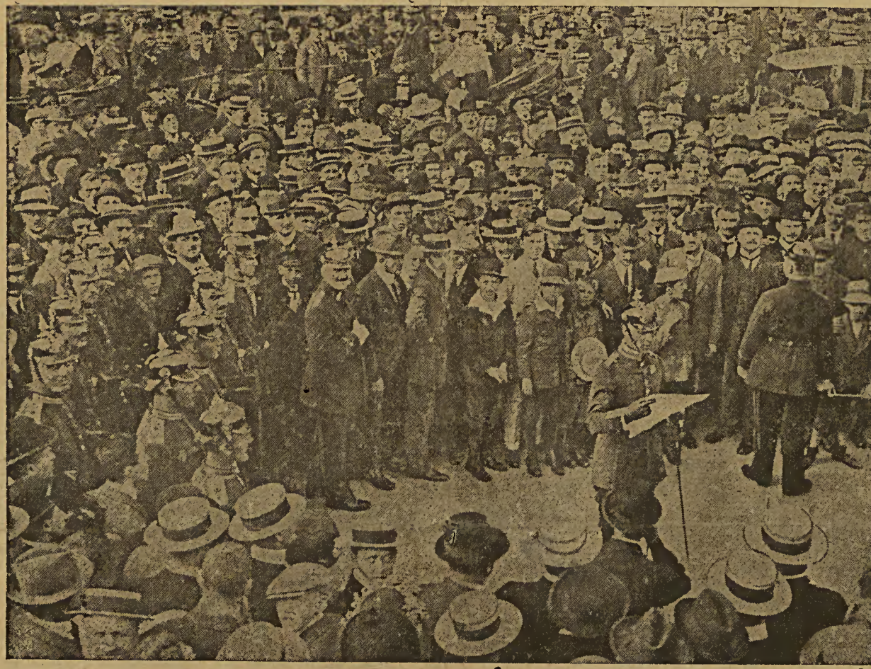
Kriegszustand in Berlin. Die Erklamierung des Kaiserlichen Erlasses unter den Linden am 31. Juli

so kann es nicht seine gesamten Streitkräfte zur Verwendung bringen. Erstens würden die revolutionären Elemente im Lande sich jede Schwächung des Militärs zunutze machen, um eine Revolution zu erregen. Zweitens würde im Fernen Osten Japan oder China die Gelegenheit ergreifen, seine politischen Ziele gegen das Zarenreich mit Gewalt durchzusetzen. Dort müssen also ebenfalls Truppen bleiben, und ebenso an der europäischen Südgrenze. Aber geschlagen wendet Rußland sich neuen Unternehmungen anderwärts zu. Das wird den Charakter des Krieges bestimmen. Es wird gewiß große Truppenmassen gegen uns ins Feld stellen, aber wenn seine ersten Operationen erfolgreich bleiben, wird dadurch die ganze Lage viel mehr beeinflusst werden, als in dem Kriege irgend einer anderen Macht, denn alle zentrifugalen Kräfte würden sich die Gelegenheit zunutze machen.