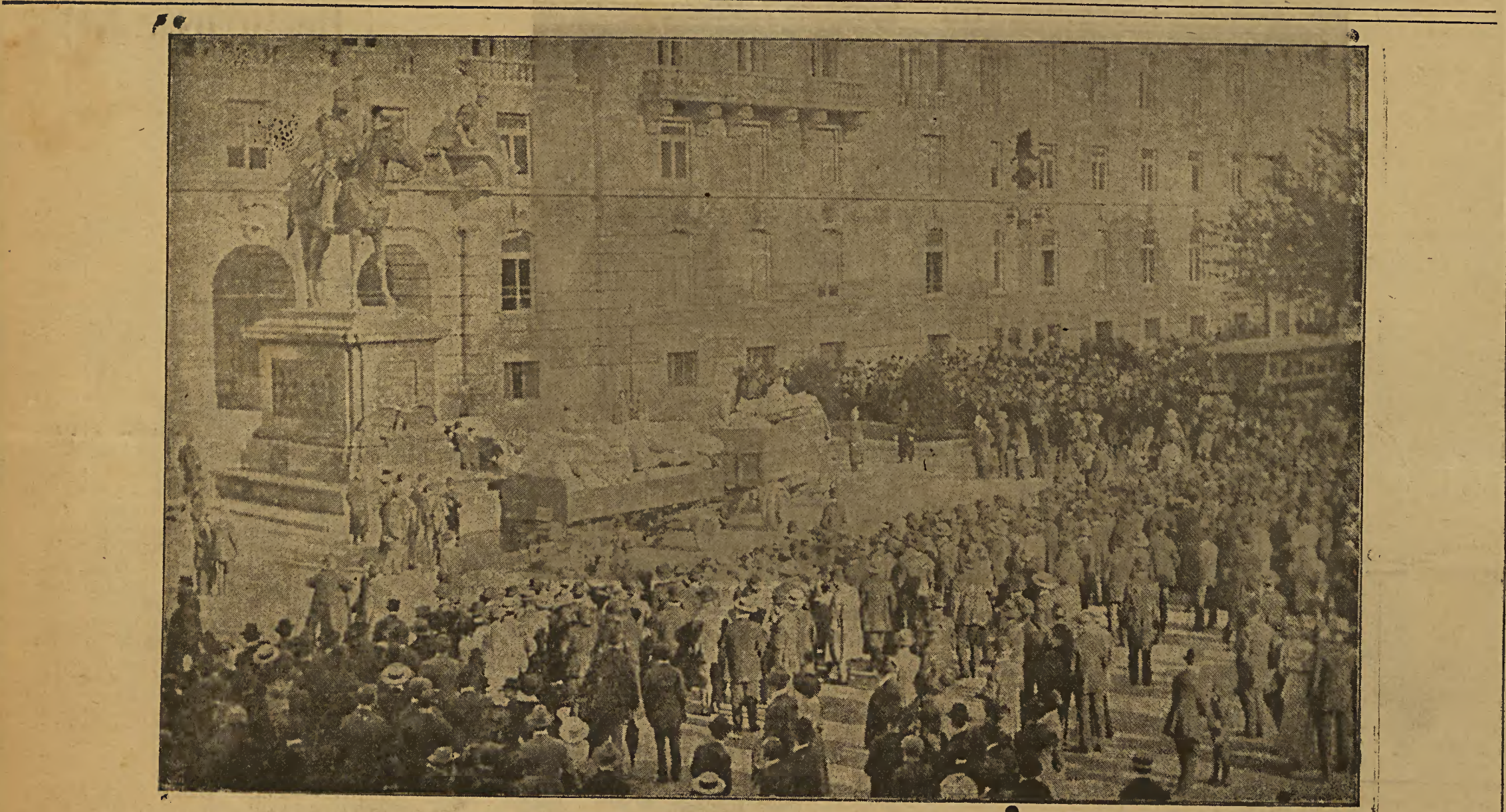
Vor dem Kriegsministerium in Wien.