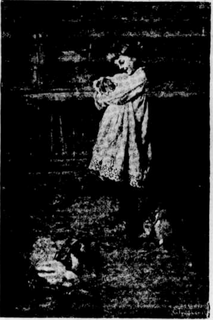
CONTENDIMENTO - Quinta do Pesco

tantes que, melhor do que nós, conhecem os nossos recursos e muito mais exactamente calculam as nossas safras todos os annos.