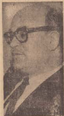
presidente do diretório municipal do extinto Partido Trabalhista Brasileiro.