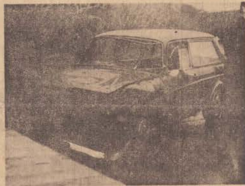
A Variant de Presidente Prudente foi atingida pela camioneta desgovernada, na SP-270, próximo à Santo Anastácio.