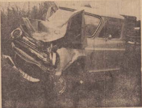
A C-10 de Presidente Venceslau, chocou-se violentamente e lançou fora seus três ocupantes