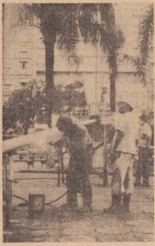
As novas luminárias começaram a ser instaladas