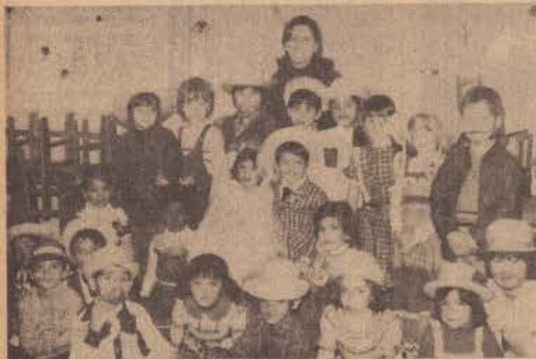
◊ Dia 29 de junho, a fes- ta junina da Escola "Se- cre Coeur", a partir das 13 horas com alunos do maternal, Jardim, pré-pre- matado e primeira série. E, pela manhã, as 8,30 horas, maternal, Jardim e pré, do período da manhã. E foi tirado esse flagranle, com os garotos e garotas, toda alegria, depois que fizeram suas apresentações. Muita pipoca, amendoim e doces.

◊ Chacrinha deveria vir hoje à Prudente, para se apresentar no Ginásio Municipal de Esportes, numa promoção do Grupo Educacional Esquema, entretanto, como ele foi para a Europa, ficou para outra oportunidade. O Grupo Educacional Esquema está dinamizando as atividades esportivas e artísticas na cidade.