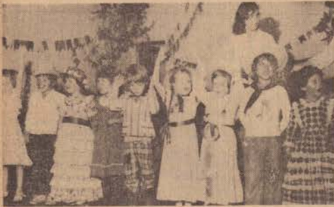
◊ A festa junina dos ga- rotos do Jardim, do Cole- gio Cristo Rei, foi uma verdadeira graça. Inven- to o casamento caplra, qua- drilha, e outros números. Estiveram presentes, as professoras, os familiares dos alunos, as irmãs, nu- ma perfeita confraterni- zação. E foi tirado o Prí- ncipe e a Princesa. Com os tickets, muito alegres.