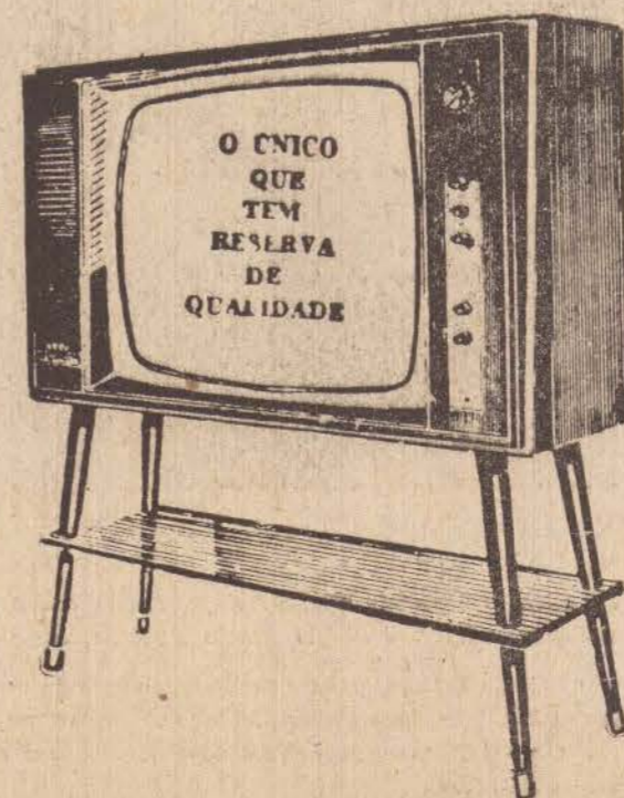
Imagem e som de presença total, com Reserva de Qualidade.