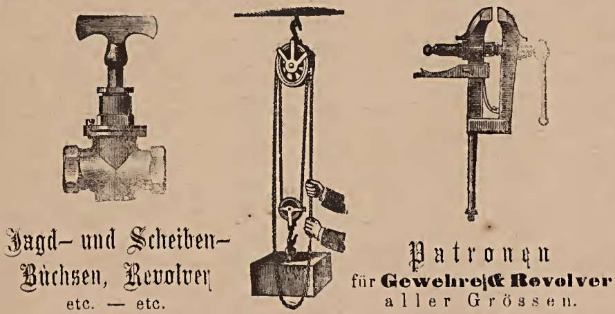
Jagd- und Scheiben-Büchsen, Revolver etc. - etc.