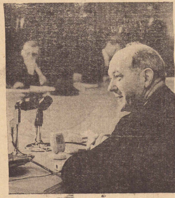
ENTREVISTA — O Secretário de estado norte-americano, D. an Rusk, respondeu perguntas que lhe formulam os repórteres, durante uma recente entrevista coletiva realizada na Universidade da Califórnia, em Berkeley. Disse Rusk que a assi natura de um acordo de banimento de provas nucleares seria um grande passo para o de- armamento e a paz. Na ocasião, o secretário do estado recebeu de sua «Alma Mater» um título honorífico.