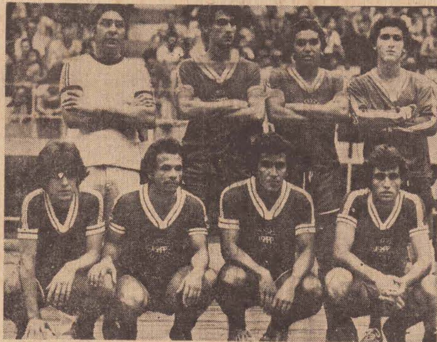
Equipe da Associação dos Servidores Municipais

A 3.ª Copamepp de Futebol de Salão promovida pela Autarquia Municipal de Esportes, está chegando ao seu final, teremos hoje no Ginásio Municipal de Esportes, o início de uma melhor de quatro pontos, onde serão apurados o campeão e o vice, na divisão especial.