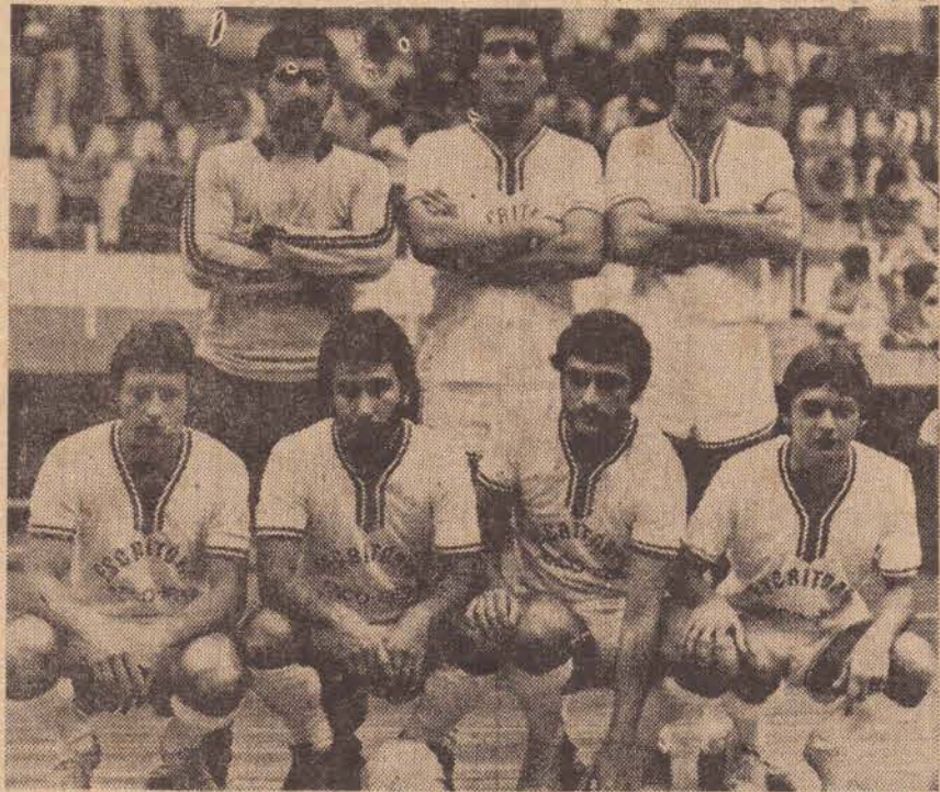
Equipe invicta do Esportivo Arco Iris