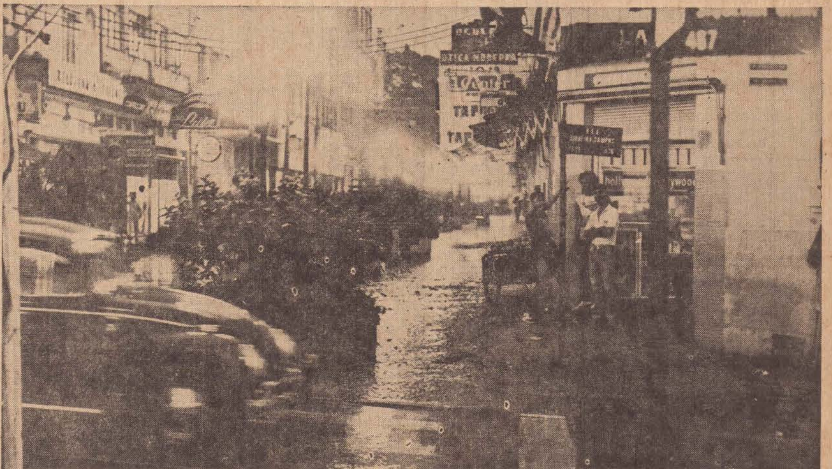
Com a escuridão, as luzes se acenderam e todos os prudentinos tiveram a estranha sensação de uma noite, em plena tarde

Mesmo evitando falar em nomes, preferindo condenar o sistema econômico que ajudaram a criar, Luiz Inácio disse que o país melhoraria sem Delfim, Murilo Macedo e Cesar Cals. "O presidente Figueiredo está muito mal assessorado" — declarou, para em seguida admitir que o presidente tenha boa intenção, "mas é impedido de promover mudanças pelo atual regime".