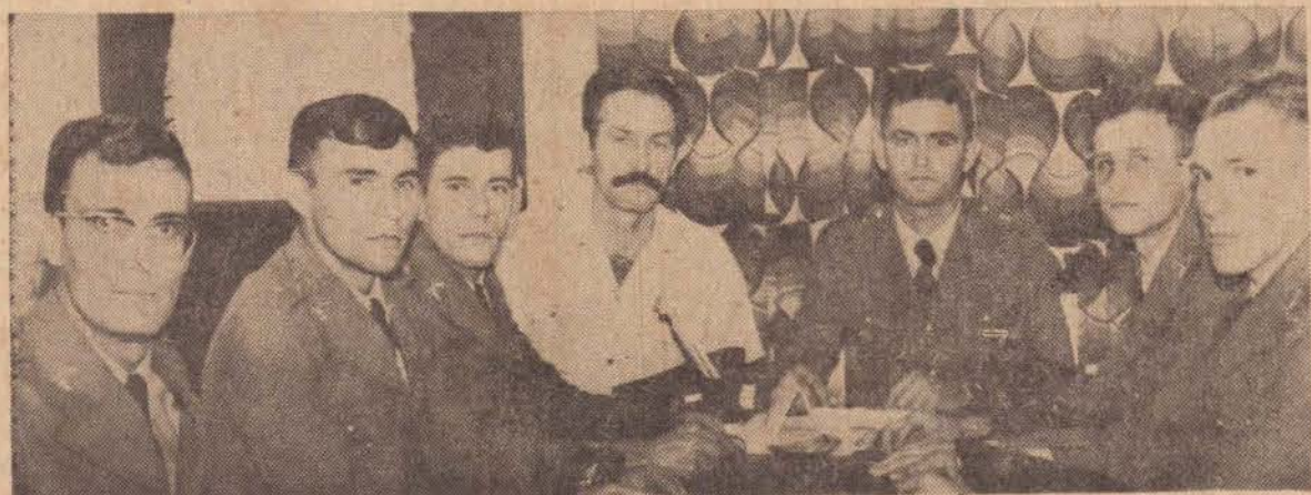
Na foto, os cadetes em nossa redação quando falavam sobre os exames para a Academia de Barro Branco