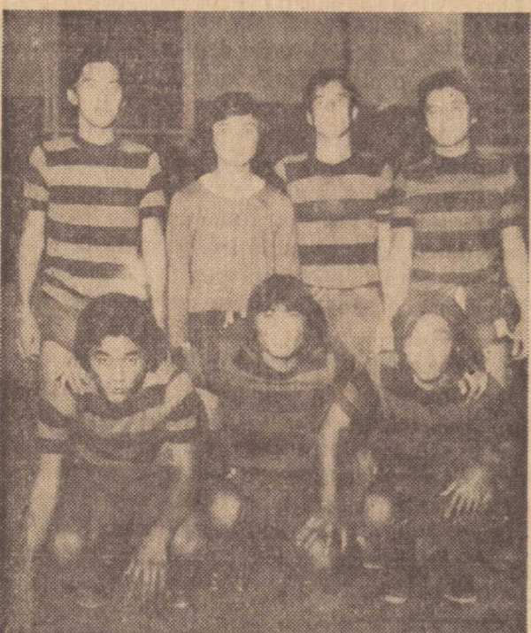
Equipe do Contabil, campeã do Campeonato em comemoração do 70.o aniversário da Imigração Japonesa no Brasil.