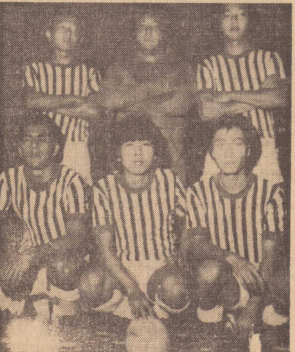
Equipe do Mitsubishi, vice-campeã do Campeonato