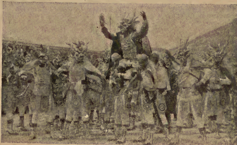
Folklore boliviano. Los «diablos» de Oruro.