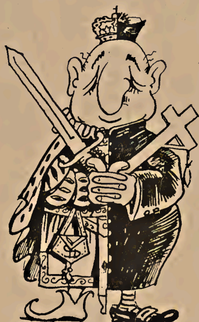
La «gracia de Dios» para desgracia de la Ciencia