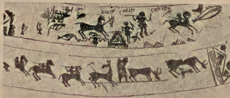
San Miguel de Liria. Escenas de caza y pesca. (De Pericot, Rev. Archéol. )

Un gran grupo —que representa el apogeo de la pintura de Liria— comprende el vaso de los guerreros a pie y a caballo, el de la dan-