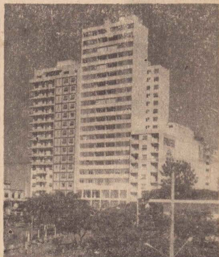
Edifício "Alexandre Fernandes"

Em princípios desta semana, foram expedidos os "habite-se" para os apartamentos do Edifício "Alexandre Fernandes" (Imoplan), que como todos sabem é um dos maiores e mais belos edifícios do interior paulista.